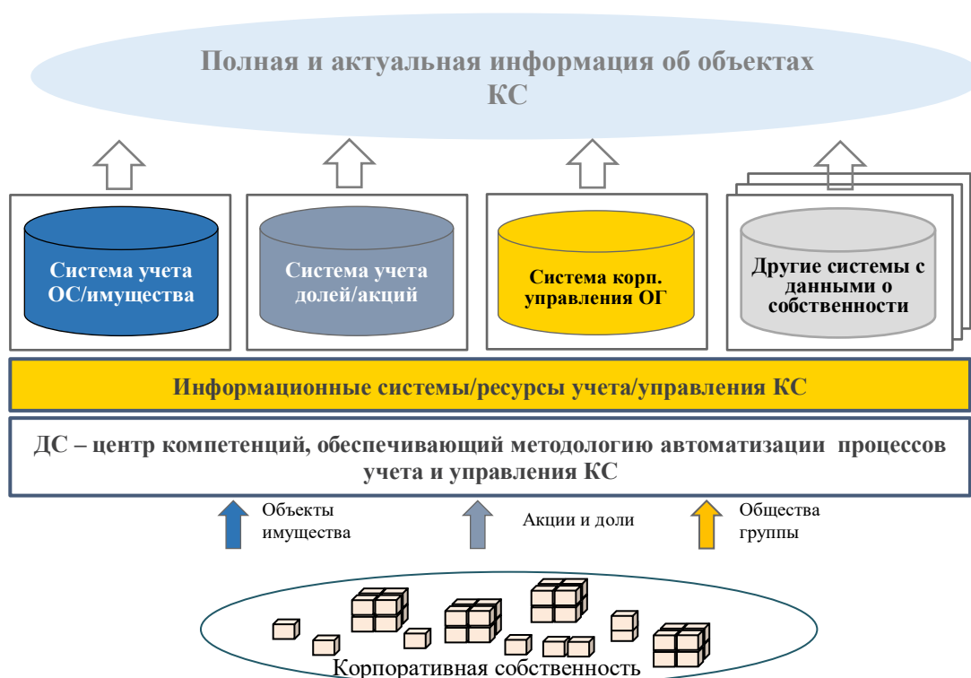
Рис. 3 Подход к автоматизации КС

Информационные решения обеспечивают автоматизацию процессов управления КС в части: