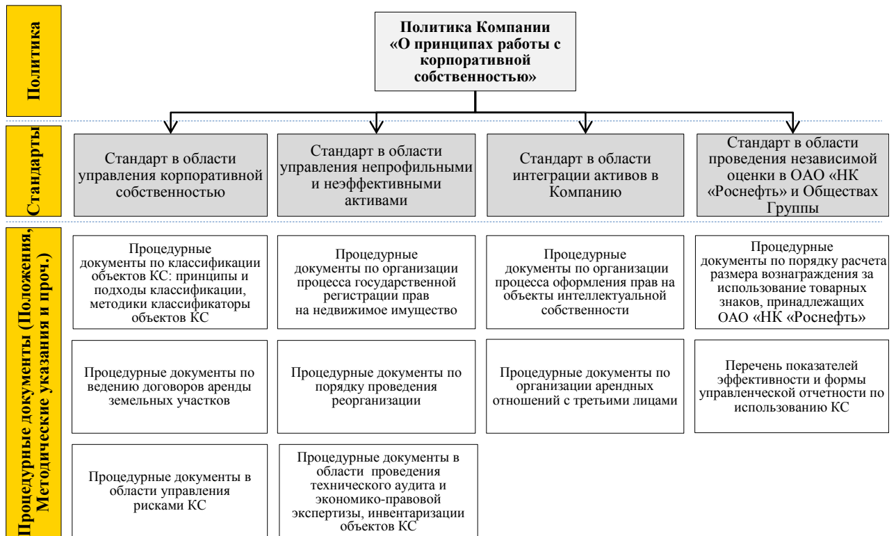
Рис. 2 Основные ЛНД, регулирующие управление корпоративной собственностью

Структура ЛНД в области управления корпоративной собственностью включает в себя настоящую Политику, Стандарты, Положения, Методические указания, Инструкции, Классификаторы и другие локальные нормативные документы. Состав ключевых ЛНД в области управления корпоративной собственностью устанавливается настоящей Политикой (Рисунок 2).